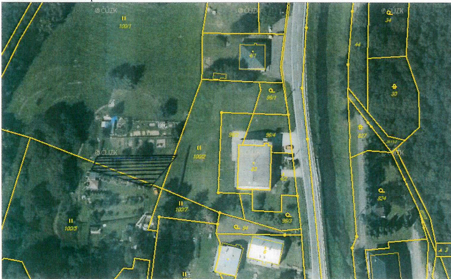
Obrázek č. 1: Zakreslení pozemku

Při pachtu pozemku bude postupováno obdobně jako v případě nájmu dle platných Zásad pro prodej, pronájem, výpůjčky pozemků a pronájem bytových a nebytových prostor v majetku obce Dívčí Hrad.