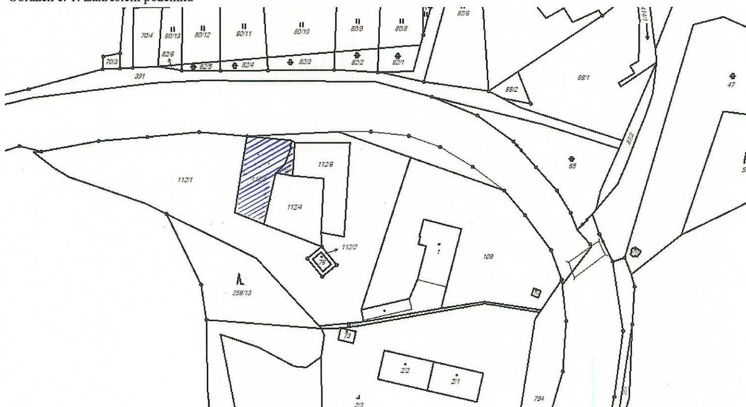
Obrázek č. 1: Zakreslení pozemků

Při pachtu pozemku bude postupováno obdobně jako v případě nájmu dle platných Zásad pro prodej, pronájem, výpůjčky pozemků a pronájem bytových a nebytových prostor v majetku obce Dívčí Hrad.