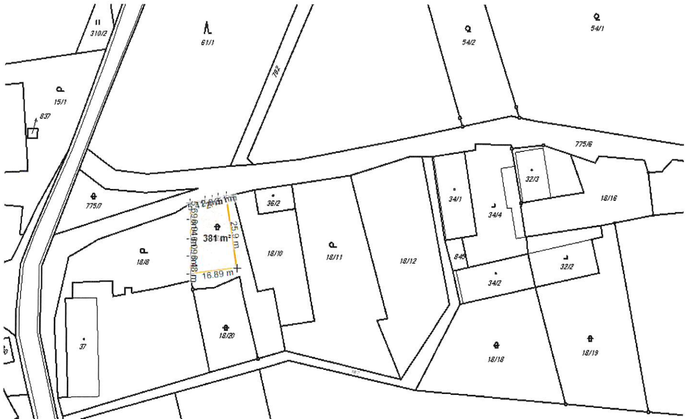
Obrázek č. 1: Zakreslení části pozemku

Při pachtu pozemku bude postupováno obdobně jako v případě nájmu dle platných Zásad pro prodej, pronájem, výpůjčky pozemků a pronájem bytových a nebytových prostor v majetku obce Dívčí Hrad.